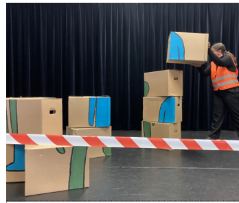
Werkpodium Kraack / Groningen Bouwplaats (meerdere optredens) 14 OKT / 11:00-12:45 uur Buitenovertredens Lammermarkt

Een film waarin documentaire en fictie in elkaar overlopen. Furia is een barok -oprijm geschreven- sprookje over moord, doodslag en erotiek met als leidraad de zeven hoofdzonden: groots verfilmd.