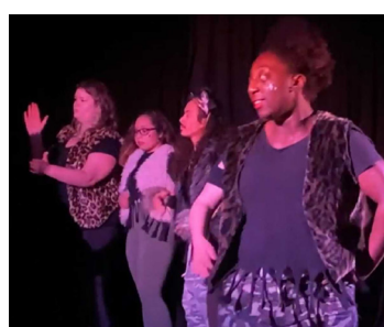
Art Loca Dance Squad / Almere The Timemachine 14 OKT / 16:00-17:00 uur Theaterzaal Domino / 2e etage

Ergens op een kantoor in Nederland... Het bedrijf Alles en Overal lijdt veel verlies, dat moet anders! Het personeel werkt er al jaren op dezelfde manier. De nieuwe baas Andrey gaat hier verandering in brengen.