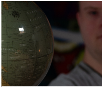
Theater Tegendraads / Wageningen Film: Hier en daar 13 OKT / 20:00-20:25 uur Theaterzaal Scheltema Leiden

Tijdens dit optreden komt de eigen sound van MOMO Theaterwerkplaats naar voren met een gezamenlijke show van de MOMO-band en het MOMO-koor. Dompel je onder in een muzikale mix, met bestaande nummers en eigen geschreven werken.