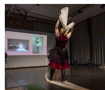
Theatergroep Domino / Leiden Heimwee 13 OKT / 19:00-20:15 uur Theaterzaal Domino / 2e etage

Lukt het de koning om zijn eigen koningin te kiezen? Op onnavolgbare wijze zetten de talentvolle acteurs geloofwaardige karakters neer in een strak vormgegeven wereld die realistischer is dan die lijkt en grappiger is dan die meestal mag zijn.