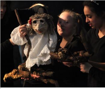
Theatergroep Domino / Leiden Violetta 13 OKT / 11:30-12:15 uur Theaterzaal Scheltema Leiden

Middenin een groot bos woont de oude Violetta. Ze zit met haar 93 levensjaren vol herinneringen uit vroegere tijden en ziet regelmatig beelden terug uit het verleden. Soms zou ze de klok terug willen draaien om bepaalde dingen opnieuw te beleven.