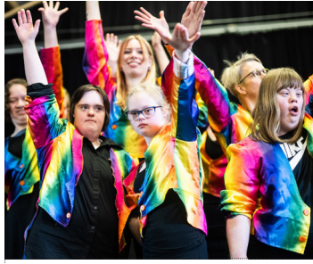
Werkpodium Kraack / Groningen Hartslag 13 OKT / 16:00-16:15 uur Theaterzaal Scheltema Leiden

Middenin een groot bos woont de oude Violetta. Ze zit met haar 93 levensjaren vol herinneringen uit vroegere tijden en ziet regelmatig beelden terug uit het verleden. Soms zou ze de klok terug willen draaien om bepaalde dingen opnieuw te beleven.