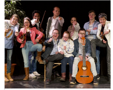
MOMO / Ederveen MOMO band & koor 13 OKT / 19:00-19:45 Poppodium Nobel / kleine zaal

Sjoerd is uniek, grappig en... anders! Hij wil graag nieuwe vrienden maken, maar dat blijkt nog niet zo gemakkelijk. Een persoonlijk document over de behoefte aan liefde en genegenheid, maar ook de angst om mensen dichterbij te laten komen.