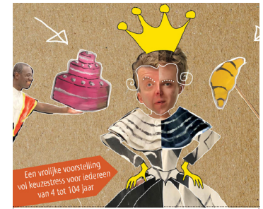
Theater Totaal / Nieuwegein De koningin die niet kon kiezen 14 OKT / 13:00-13:30 uur Museum de Lakenhal / auditorium

Een kort optreden in de buitenlucht. Als men in een eigen bubbel leeft en amper oog heeft voor de ander, heb je eigenlijk ook niemand nodig. Je hoeft geen nabijheid en zeker al geen fysiek contact. Maar wat doe je als de situatie zo verandert dat je wel een ander nodig hebt?