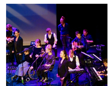
Theater Totaal / Nieuwegein Band Total Loss 14 OKT / 20:30-21:30 uur Poppodium Nobel / kleine zaal

Heimwee is voor iedereen iets anders: een vertrouwde plek of persoon die er niet meer is, maar ook een verlangen naar iets waar je nog nooit bent geweest. Het geeft ons een gevoel van vreugde en weemoed; het brengt ons aan het lachen en laat ons stil worden.