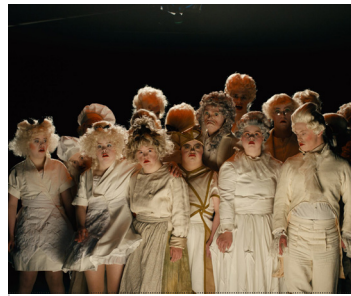
KamaK / Hengelo Film: Het zit in mijn hart 13 OKT / 20:30-22:00 uur Theaterzaal Scheltema Leiden 14 OKT / 16:00-17:45 uur Bioscoop Kijkhuis (incl. nagesprek)

Een heuse roadmovie door Wageningen. Geschreven en gemaakt door de acteurs van Theater Tegendraads. Muziek verbindt, dat blijkt wel uit deze film. Deze film is ontstaan toen de theaters in Nederland gesloten waren.