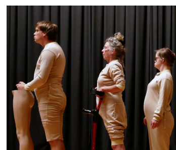
Carte Blanche / Eindhoven Maar niemand kuste mij 14 OKT / 14:45-15:15 uur + 19:30-20:00 uur Marktsteeg 10

Dit is mijn verhaal. Ik droom van de zee en het strand. Van vissen, koraal en spetterende meisjes. Uit deze zee wordt een zeegod geboren en een engel. Mijn vader heeft een boot die kan varen en nu vaart hij al een tijdje niet meer hier.