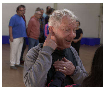
Theater Babel / Rotterdam Film: Altijd alles anders 14 OKT / 13:00-14:30 uur Bioscoop Kijkhuis (incl. nagesprek)