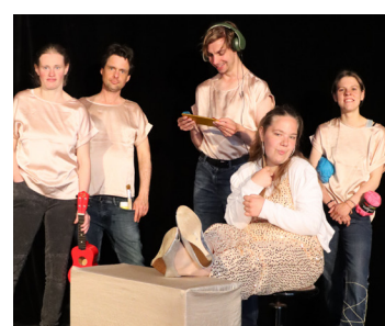
De Rode Hoed / Zutphen Ik 14 OKT / 16:00-17:30 uur Poppodium Nobel / kleine zaal

Wat gebeurt er wanneer een jonge game-verslaafde plotseling een tijdmachine in handen krijgt? Een uptempo opzwepende dansmusical waarbij het publiek spontaan zin krijgt om te dansen!