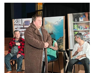
Fenix Theatermakers / Den Haag Mongens en Jeisjes 14 OKT / 15:30-16:15 uur Museum de Lakenhal / auditorium

Waarom bestempelen we mensen als 'normaal' en 'abnormaal'? Wat gebeurt er als we dit onderscheid loslaten? Een auditieve voorstelling waarin de heersende norm over wat normaal is wordt bevraagd. Laat je verrassen en verleiden!