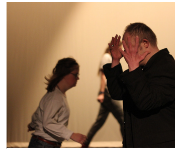
KamaK / Hengelo Stil (meerdere optredens) 14 OKT / 11:00-13:00 uur Buitenovertredens Beestenmarkt

Een kort optreden in de buitenlucht. De bouwers van Kraack zijn op zoek naar de perfecte mens. Met veel zorg en aandacht proberen ze steentje voor steentje de mens in elkaar te zetten. Maar wat maakt hem eigenlijk perfect?