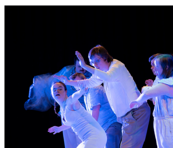
Theaterwerkplaats Tiuri / Breda De parel in de oester 14 OKT / 13:45-14:25 uur + 14:45-15:25 uur Theaterzaal Scheltema Leiden

Deze film neemt je mee in het repetitieproces waar een groep acteurs samen verhalen ontwikkelt over mogen zijn wie je bent. Enkelen van hen vertellen over hun eigen ervaringen in het vinden van hun weg in een artistieke loopbaan.