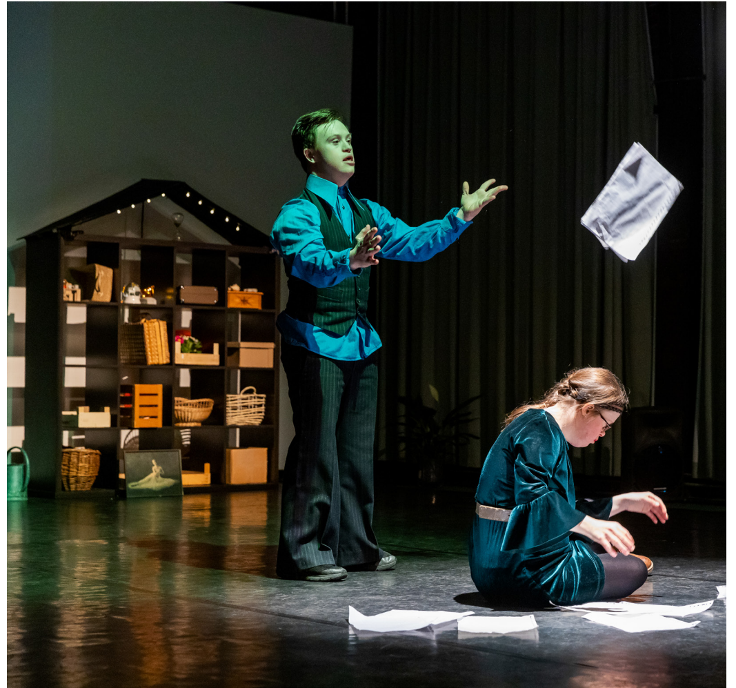
Fotograaf Patricia Nauta - foto uit voorstelling Heimwee / Theatergroep Domino

Met het festival wil de VOT aandacht genereren voor acteurs met een beperking en zo (verdere) profilering en professionalisering van de theatergroepen te bereiken. Want zij zijn tot veel, heel veel in staat! Karakteristiek voor de professionalisering is dat de mensen met een beperking centraal staan, er wordt VANUIT deze mensen gewerkt. Het doel is om structureel zichtbaar te worden en gelijke kansen te krijgen in het huidige kunst- en culturaanbod. Het wordt tijd dat theater door mensen met een beperking de normaalste zaak wordt.