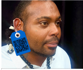
Theater Tegendraads / Wageningen Wij zijn exclusief 13 OKT / 16:00-16:25 uur Poppodium Nobel / kleine zaal

Hartslag is een dans over het ontstaan en bestaan van Kraack en haar spelers. De groei die zij individueel, maar ook met elkaar maken. Voor en door elkaar.