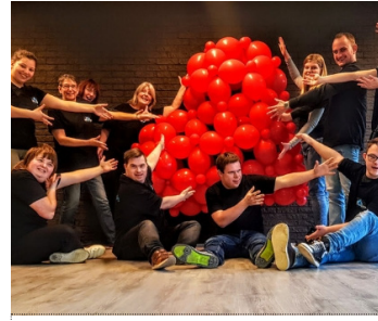
Art Loca De Hartwerkers / Almere Hartcore 13 OKT / 16:00-16:25 uur Theaterzaal Domino / 2e etage

Wie ben je dan, waar sta je voor? In deze voorstelling worstelen de spelers met de volgende woorden: alleen, buitengesloten en afgewezen. Ze laten zien waar wij allemaal mee stoeien. Want hoe zit het nou eigenlijk?