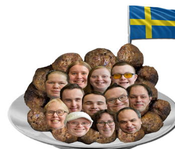
Toltheater / Gorinchem Hej hej, variété 14 OKT / 13:00-13:30 uur Theaterzaal Domino / 2e etage

Welke jurk zal de koningin aandoen vandaag? Zou ze met de fiets gaan of met de koets? Ze kan niet kiezen. En wie moet er een standbeeld van haar maken? Een groep acteurs stort zich op deze voorstelling vol besluiteloosheid. En wie kan eigenlijk het beste de koningin spelen?